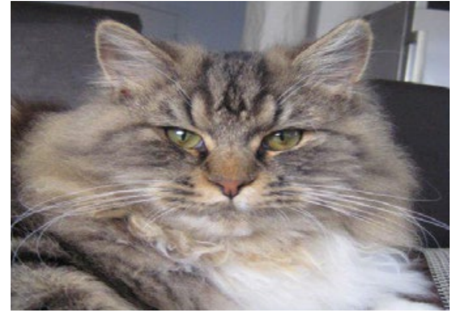
Kongen af Morbærhaven - Misiu

R edaktionen vil gerne invitere de forskellige kæledyrsejere i Morbærhaven til at dele 1-2 billeder og lidt tekst omkring deres kæledyr.