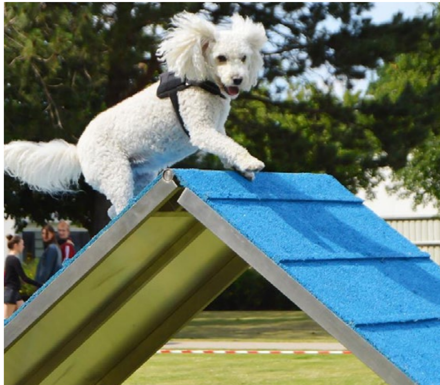
Kongen af Morbærhaven - Misiu

Vi vil glæde os til at se hvilke fantastiske kæledyr, der bor i Morbærhaven.